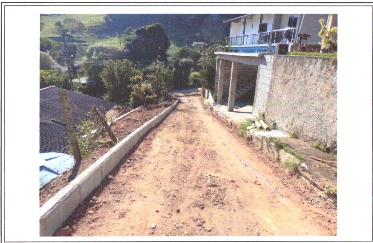
Bom Jardim, RJ, 08 de maio de 2024.